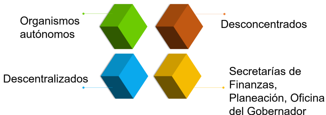
Figura 1. Naturaleza de los organismos de monitoreo y evaluación

Las entidades federativas han dotado de las atribuciones en materia de monitoreo y evaluación de la política de desarrollo social a diversas áreas. Básicamente, se puede identificar cuatro organismos rectores del monitoreo y evaluación con naturaleza diferente: 1) organismos autónomos; 2) unidades descentralizadas de la Secretaría de Desarrollo Social o similar 3) unidad desconcentrada de la Secretaría de Desarrollo Social o similar o 4) unidades que forman parte de la estructura de las Secretarías de Finanzas o Planeación o de la Oficina del Gobernador (Ver figura 1).